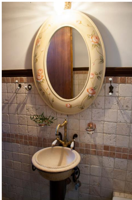
Liebe zum Detail