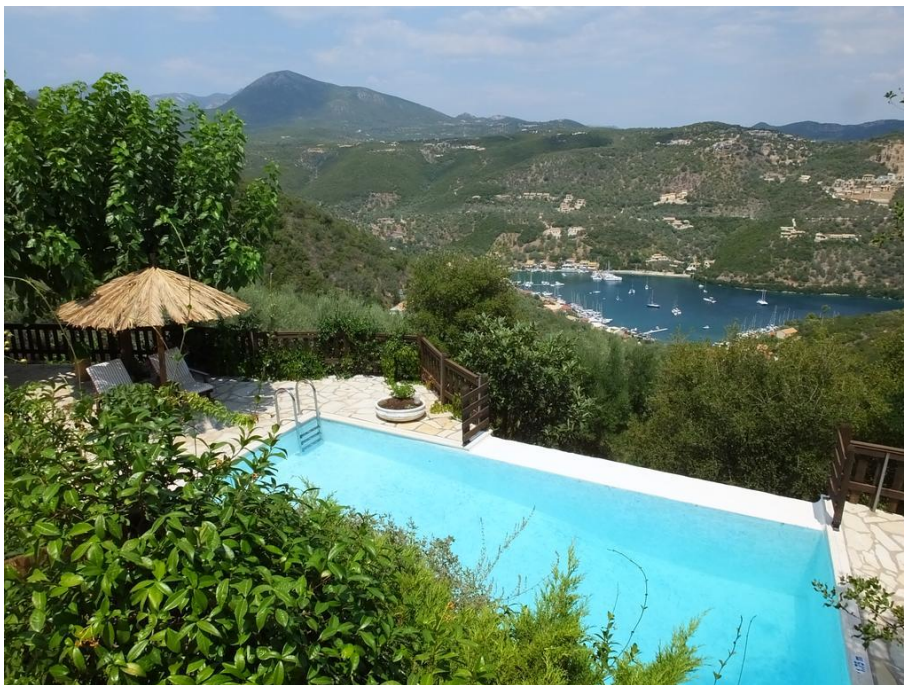
traumhafte Lage und Blick