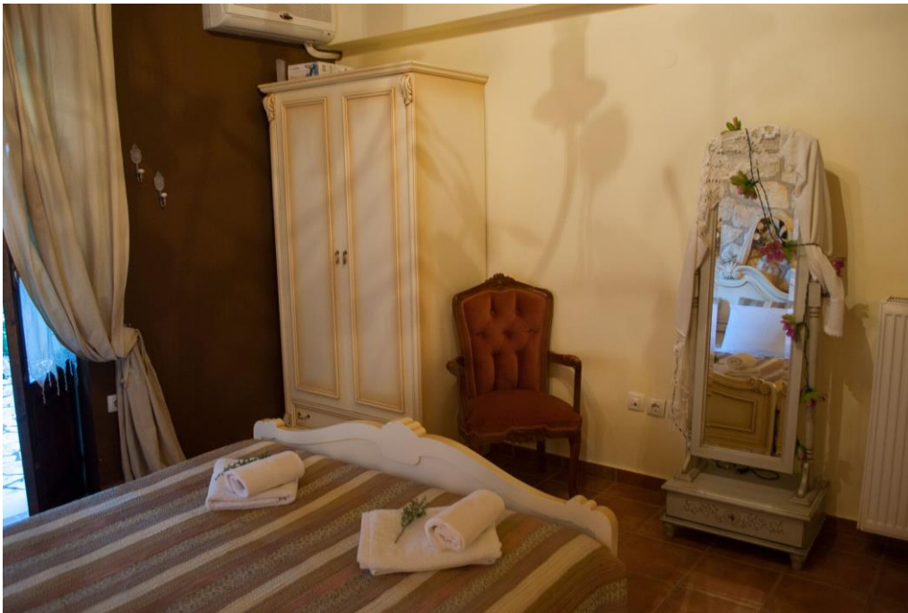
Möbel im Landhausstil