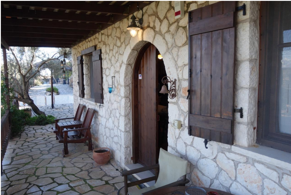
Kommen Sie herein