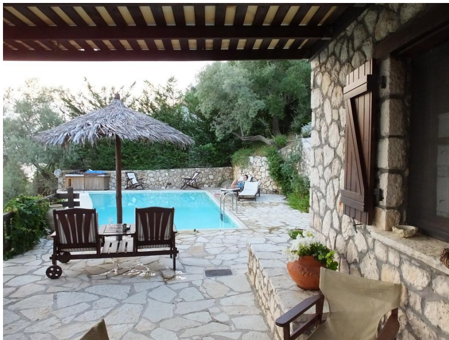
erfrischen Sie sich am Pool!