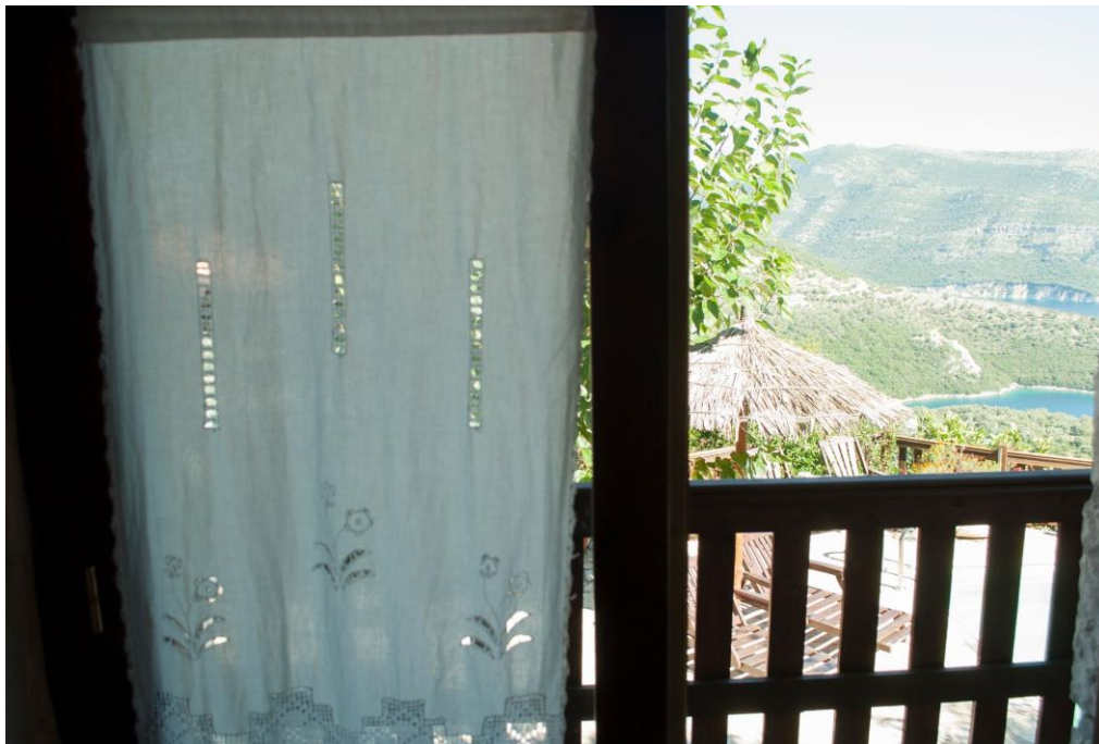
Ausblick aus dem Schlafzimmer