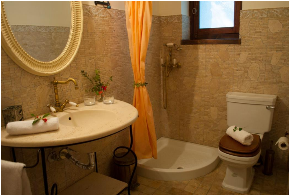
weiteres Bad mit Dusche