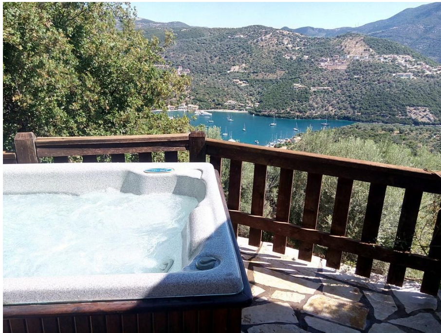
oder auch im Whirlpool!