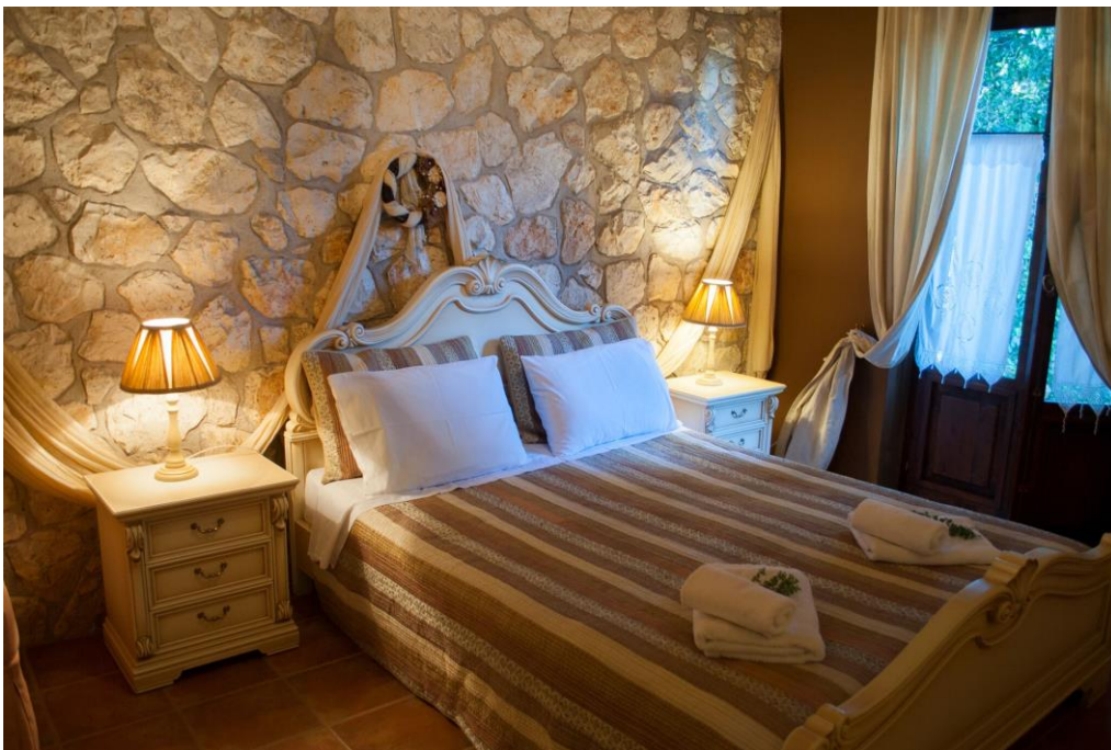
Natursteinwand im Schlafzimmer