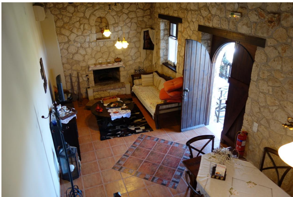
Wohnzimmer einer der Villen