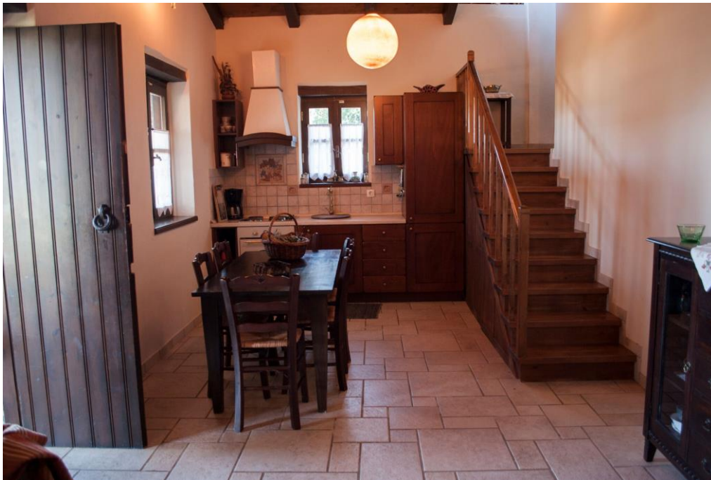
schöne Küche mit Essbereich