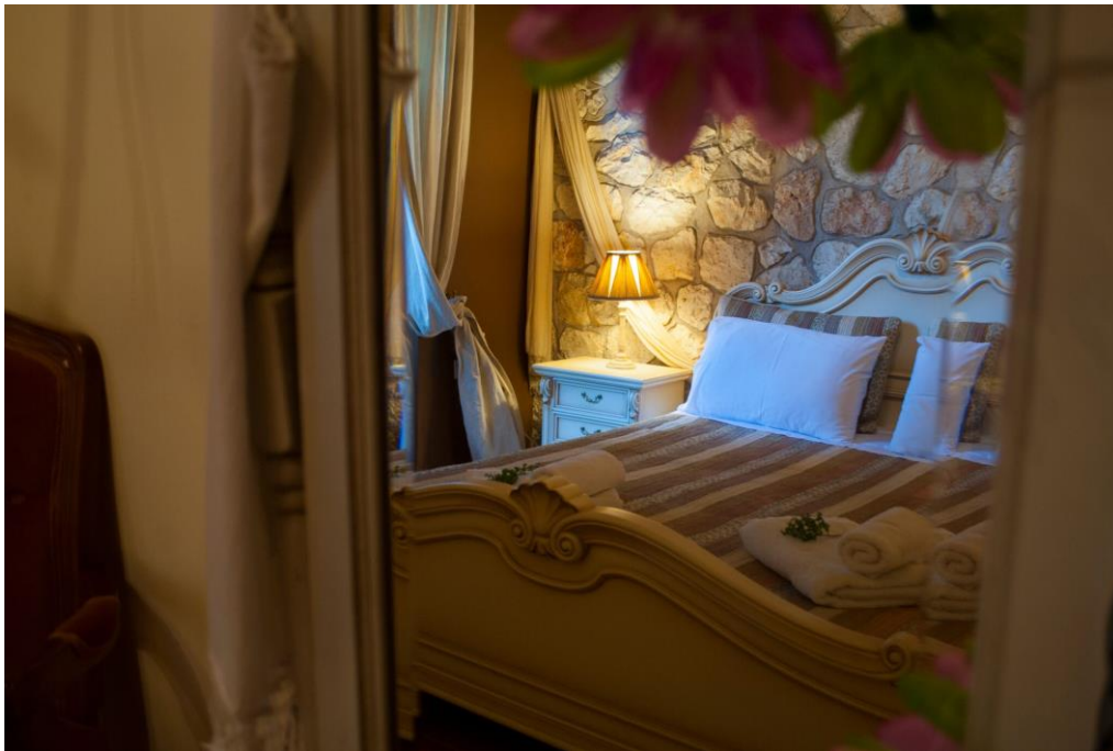
hier schlafen Sie himmlisch