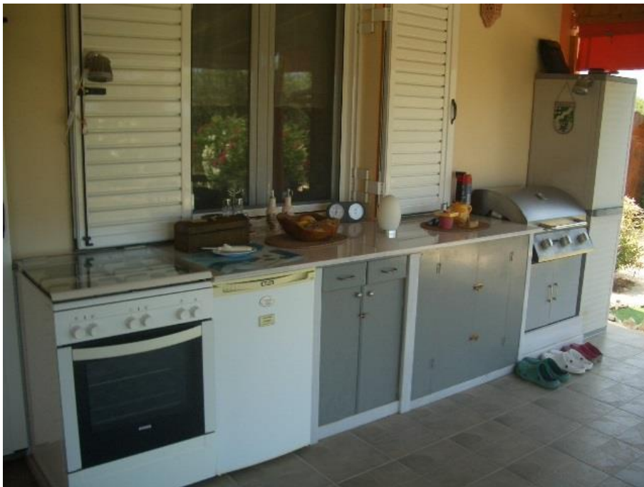
die ideale Aussenküche