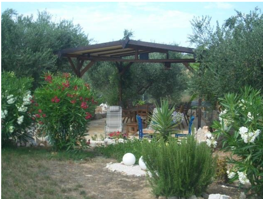
sehr gepflegter Außenbereich