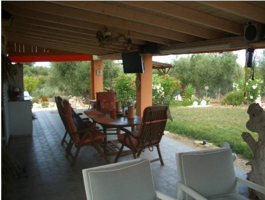
Blick auf die grosse Terrasse