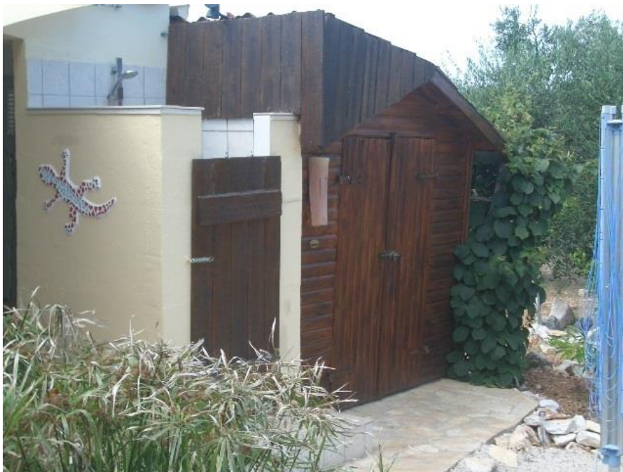
Erfrischungsstation im Garten