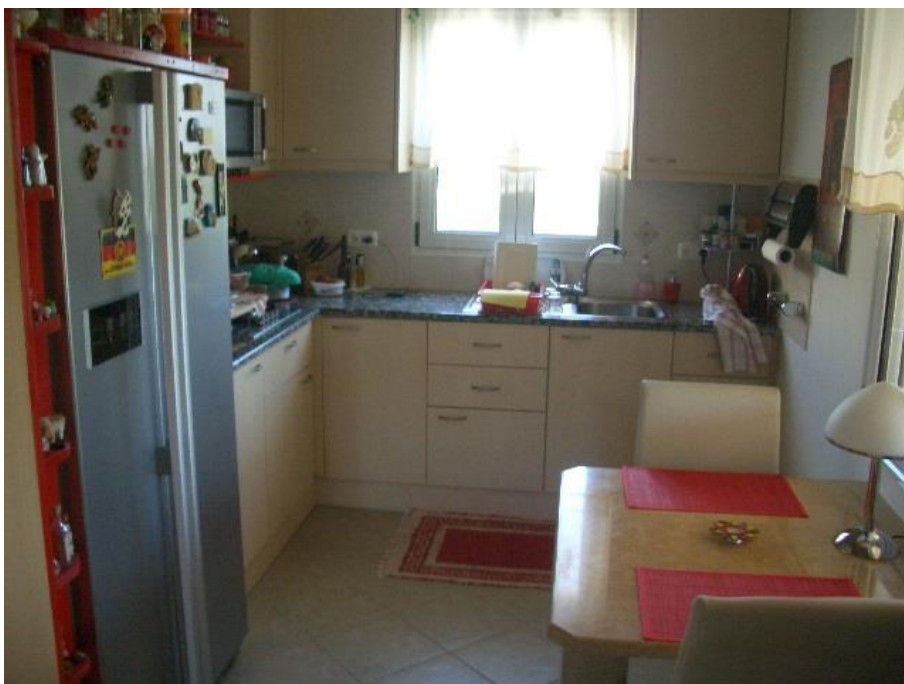
komplett ausgestattete Küche