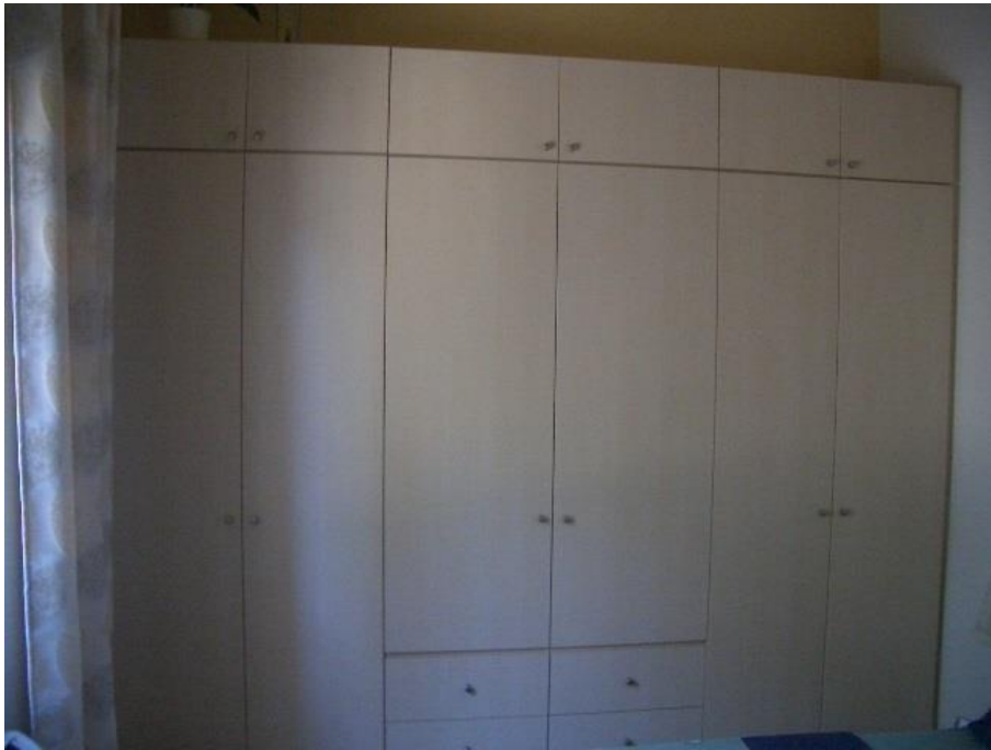
Einbauschränke im Schlafzimmer