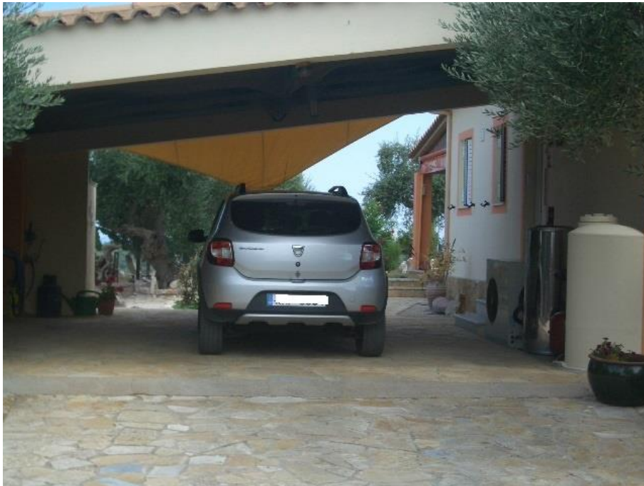
Carport - Platz für zwei Autos