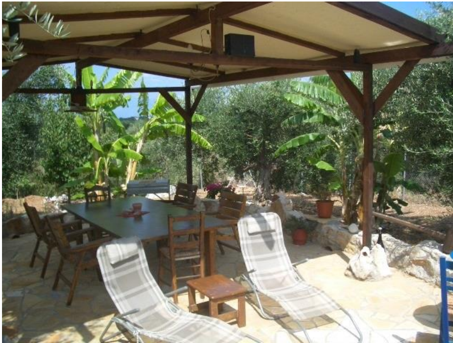
Sitzmöglichkeiten im Pavillon