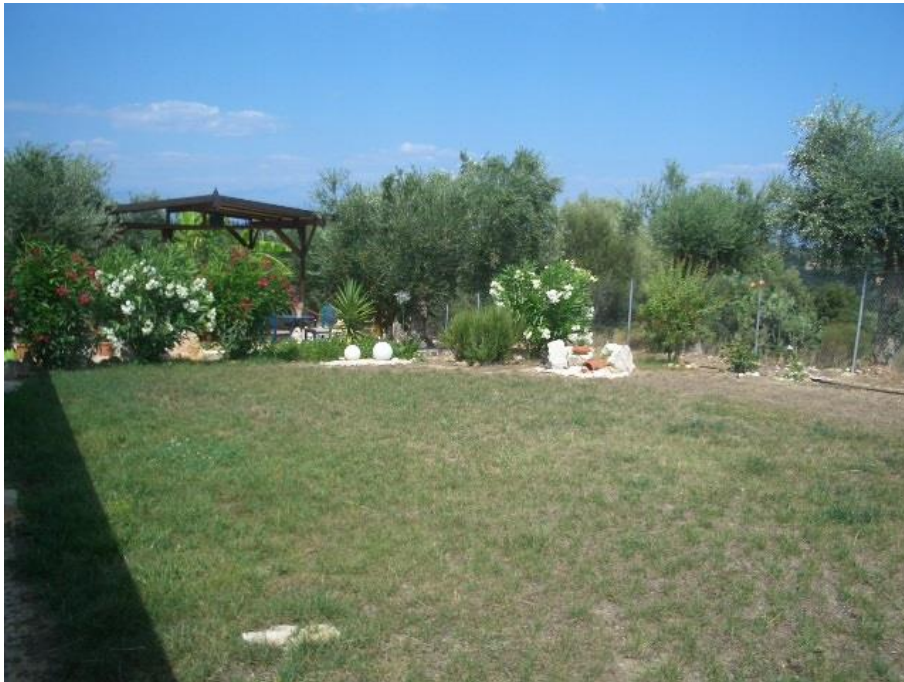
Ihr kleines Paradies