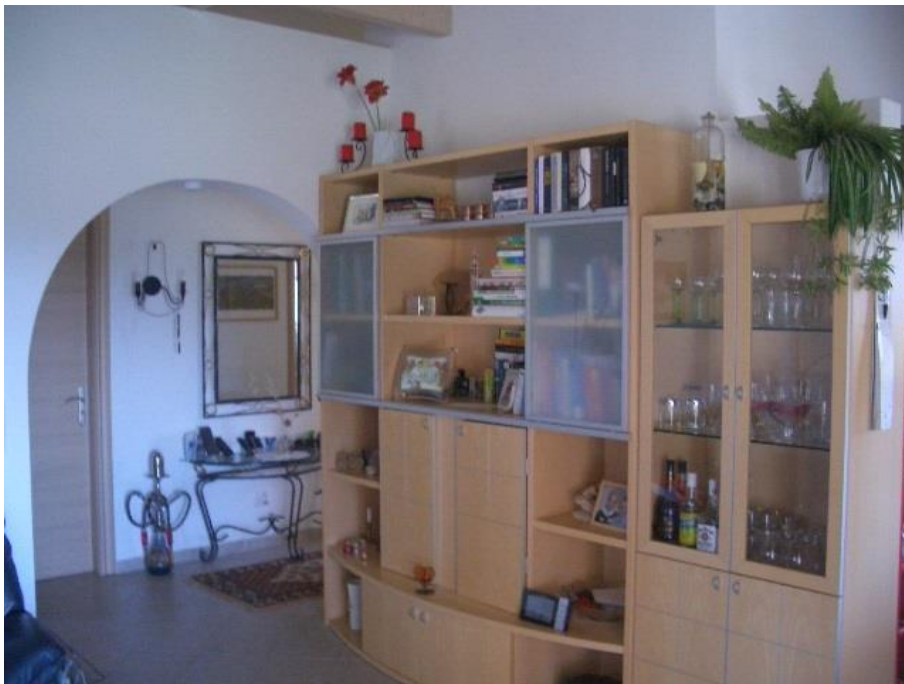
weitere Ansichten Wohnzimmer